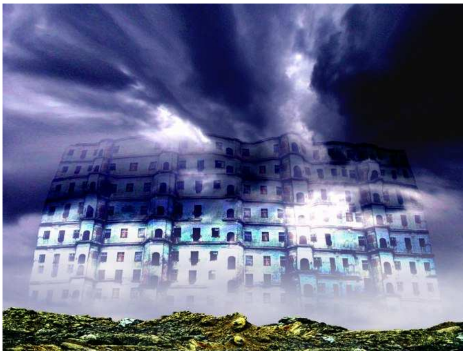
Zdzisław Beksiński - grafika komputerowa 1999

21 lutego br. późnym wieczorem do Beksińskiego przyszło dwóch nastolatków. Zadali mu kilkanaście ran kłutych. Zabili. Powód? Nie chciał pożyczyć pieniędzy. Zgodnie z ostatnią wolą artysty pochowano go w Sanoku - tam, gdzie się urodził.